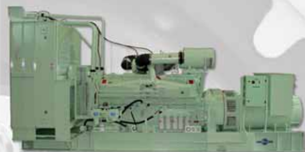
Anwendungsbeispiel: Aggregat mit Dieselmotor Application example: Aggregate with Diesel engine