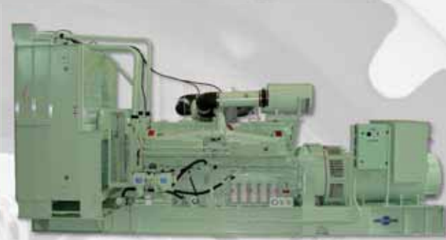
Ejemplo de aplicación: grupo con motor diesel Application example: Aggregate with Diesel engine