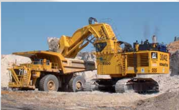
Ejemplo de aplicación: excavadora Application example: Excavator