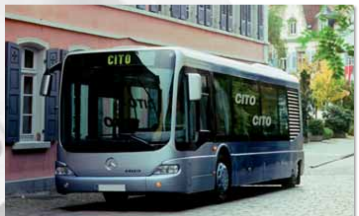
Ejemplo de aplicación: tecnología de transporte Application example: Mobile technology