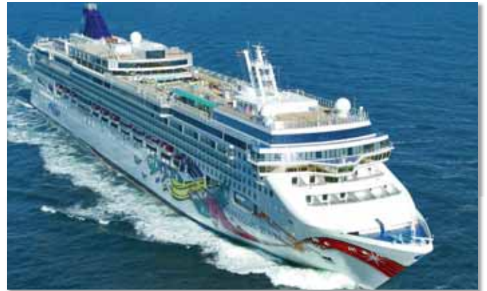
Ejemplo de aplicación: sector naval Application example: Marine