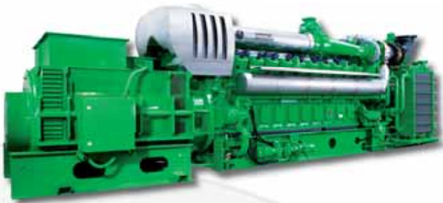
Ejemplo de aplicación: grupo con motor a gas Application example: Aggregate with Gas engine