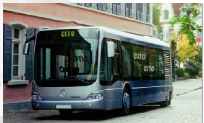
Exemple d'application : techniques mobiles Application example: Mobile technology