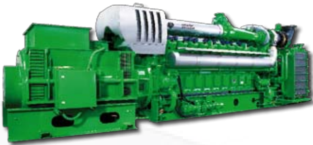
Exemple d'application : groupe avec moteur au gaz Application example: Aggregate with Gas engine