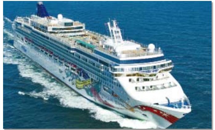
Exemple d'application : marine Application example: Marine