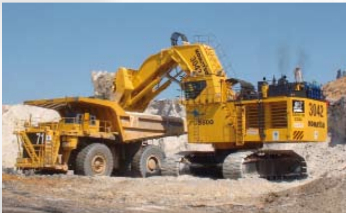
Exemple d'application : pelleuse Application example: Excavator