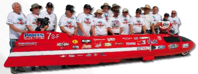
Exemple d'application : poste de contrôle de moteurs de course Application example: Racing engine test bench